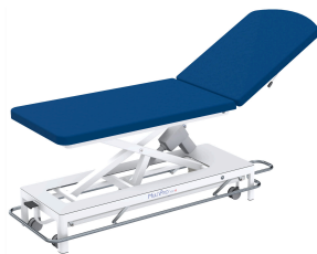
Behandlungsliege MultiPro® next 2