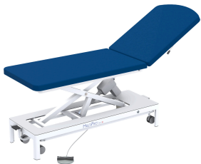
Behandlungsliege MultiPro® next 2 «eco» mit Fusstaste

Weitere Varianten finden Sie in unserem Online Shop