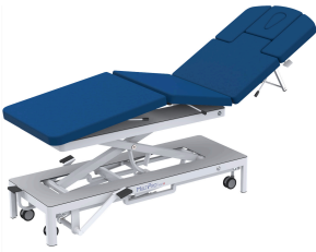
Therapieliege MultiPro® next 6 «pump» mit Hydraulikpumpe

Weitere Varianten finden Sie in unserem Online Shop