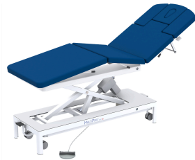
Therapieliege MultiPro® next 6 «eco» mit Fusstaste