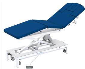
Therapieliege MultiPro® next 6 «eco» mit Fusstaste

Weitere Varianten finden Sie in unserem Online Shop