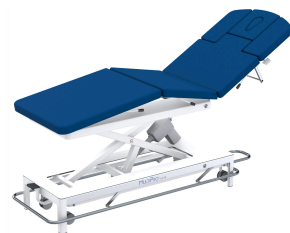
Therapieliege MultiPro® next 6