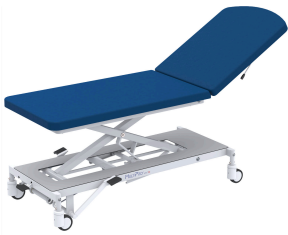
Patiententransporter MultiPro® next Praktitrans 2 «pump» mit Hydraulikpumpe

Weitere Varianten finden Sie in unserem Online Shop